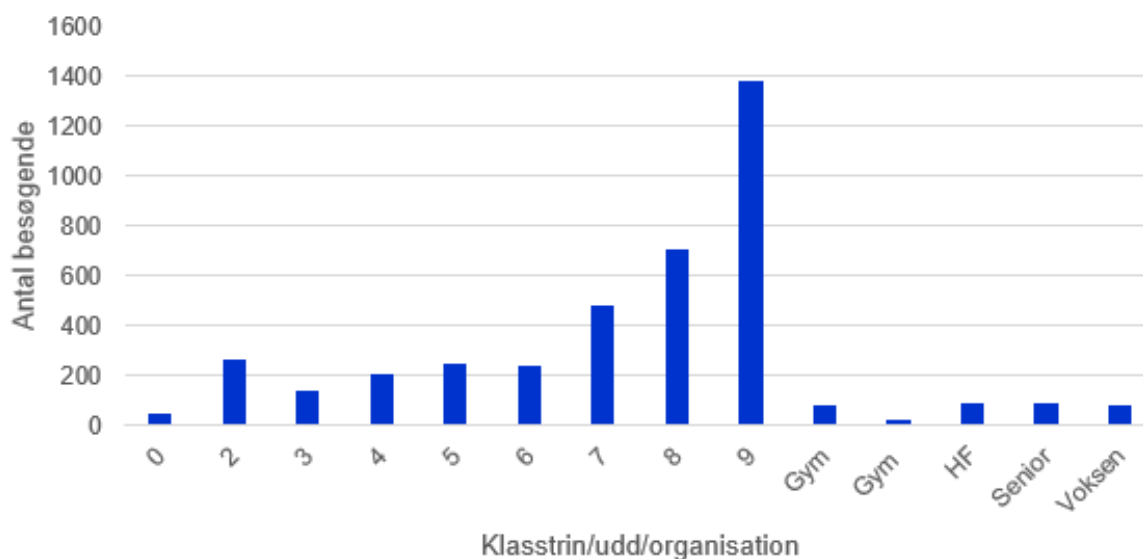
Figur 4: Antal besøgende fordelt på klasstrin, uddannelsessteder og organisationer.

De fleste besøgende kommer fra udkolingen, hvor 9. klasserne udgør den største gruppe. I 2023 besluttede besøgstjenesten at stoppe med at tage nye bookinger fra indskolingen til renseanlæggene. Det skete efter grundige overvejelser om sikkerheden for eleverne. I stedet vil indskolingen blive guidet til besøg på vandværkerne i fremtiden.