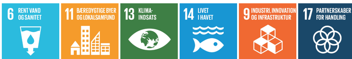
Figur 1: De seks verdensmål

Vi er forpligtede over for vores kunder, vores ejerkommuner og vores samarbejdspartnere. Med afsæt i Novafos strategi, har vi udpeget seks verdensmål og seks indsætter – tre kerneindsatser og tre særlige indsætter.