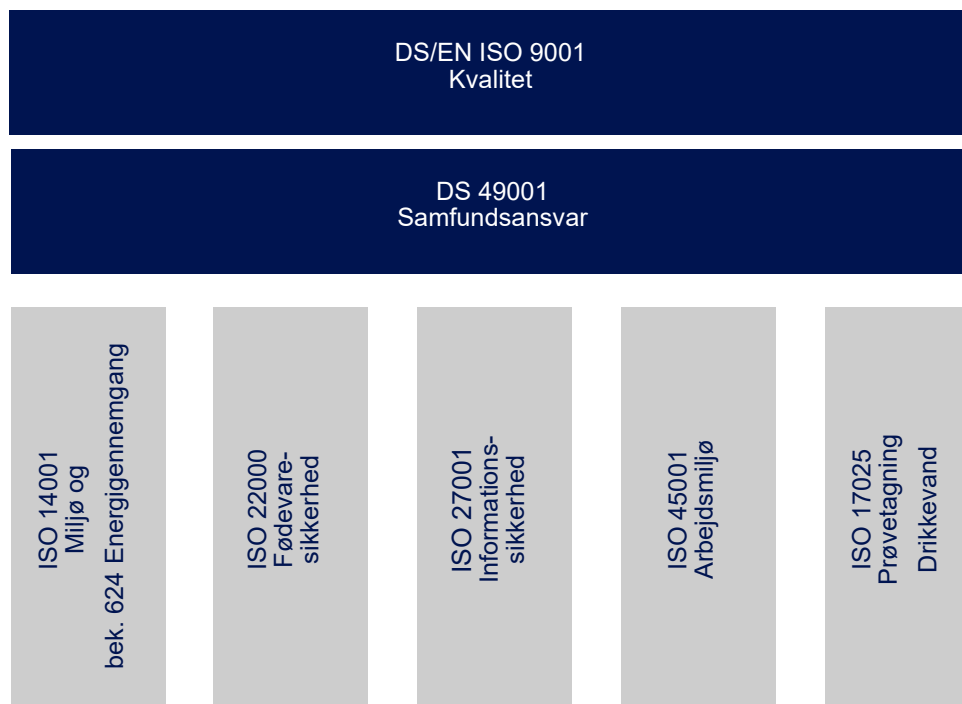
Figur 3: Novafos certificeringer ved udgangen af 2023.

I 2023 har vi opdateret vores politikker, og vi har haft særlig fokus på klima og bæredygtighed i forbindelse med vores anlægsaktiviteter og forhold, der vedrører arbejdsmiljø – såvel internt i organisationen